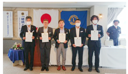
モナーク・シェブロン贈呈