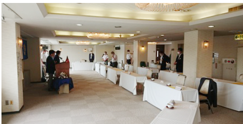
ソーシャルディスタンスを確保した例会の配席