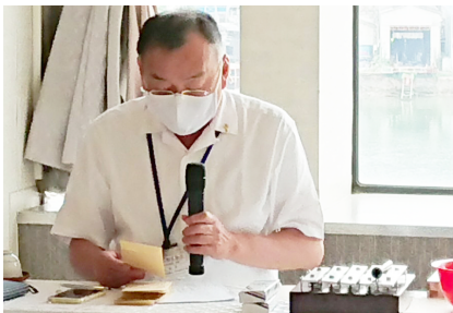
本年度最後のテールツイスターの時間