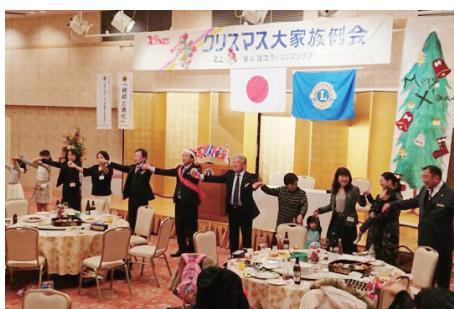
輪になって「また会う日まで」