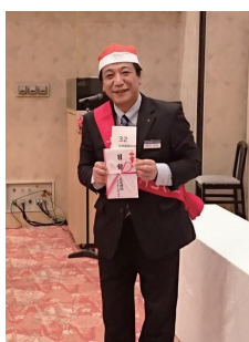
前川次期会長エレクトと青澤次期幹事エレクト