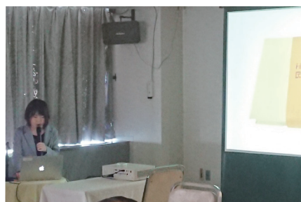
地域活性化企画入賞者の発表