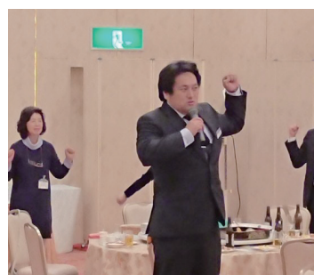
川口幹事 ライオンズローア

12月18日（水）午後6時半から尾道国際ホテルにおいて尾道瑠璃ライオンズクラブ第1365回クリスマス家族例会が行われた。