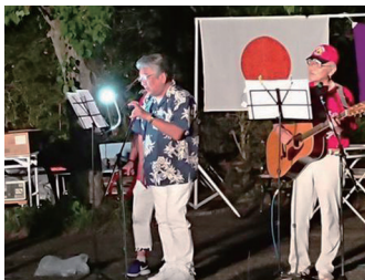
九十九さん 飛び入り参加