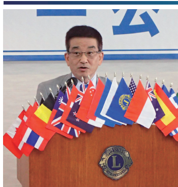
高橋地区ガバナー 挨拶