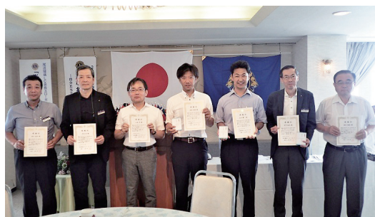
前年度クラブ役員に感謝状