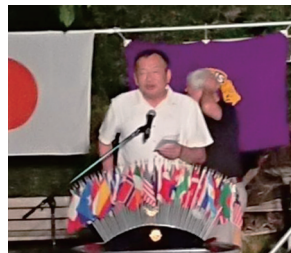
阿形テール 酔っ払っている