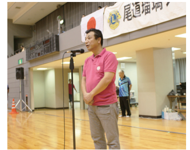
前川第一副会長 閉会挨拶