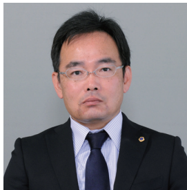
尾道瑠璃ライオンズクラブ 57代会長