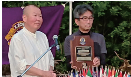
木曾ZCへM J F盾の贈呈