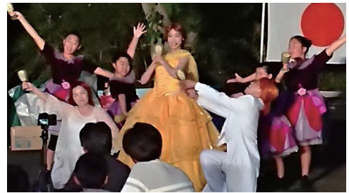
アトラクション「美女と野獣」