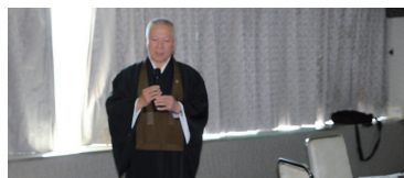
演題は葬儀と相続