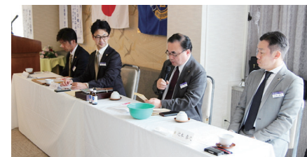
お待ちかねテールツイスターの時間