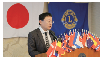
森数次期役員指名委員長 発表