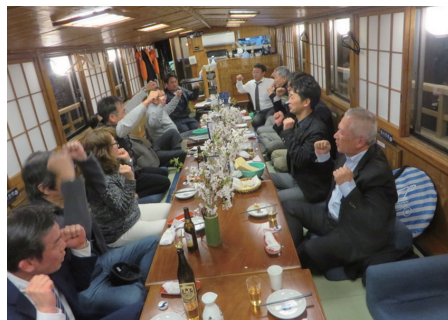
ライオンズローア