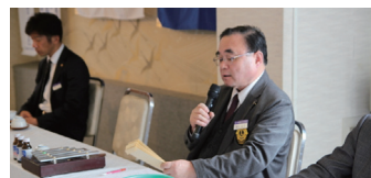
お待ちかねテールツイスターの時間