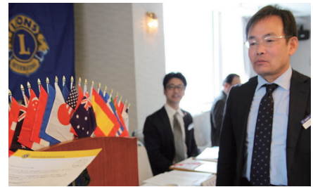
100周年記念会員増強賞