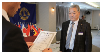
第65回地区年次大会任命書伝達