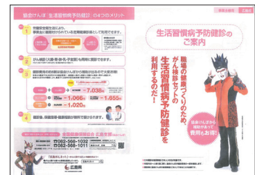
生活習慣病予防健診のご案内