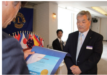
国際会長感謝状 授与