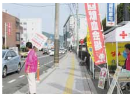
10月20日、尾道駅前港湾駐車場にて献血活動を実施しました。献血の受付をいただいた方にはOnomichi U2の買い物券500円を贈呈しました。天候にも恵まれ、多くの方に献血のご協力をいただきました。