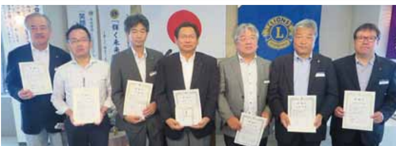
前年度クラブ役員に感謝状