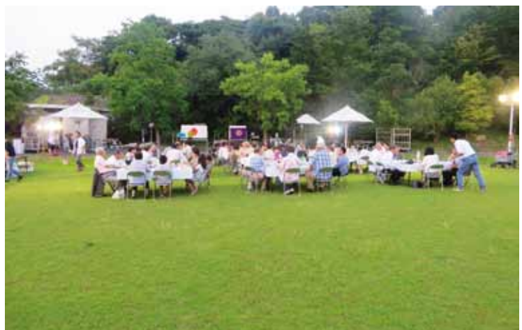
向島洋らんセンター 芝生広場での例会風景