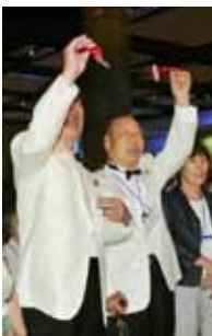
ガバナー就任の瞬間