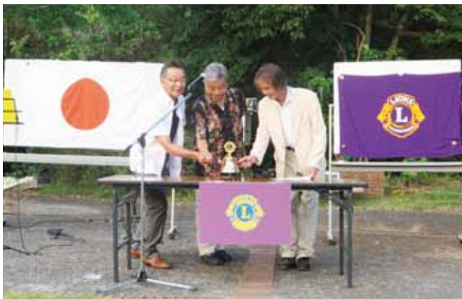
3クラブ会長 開会ゴング

ホスト：尾道向島LC 尾道瑠璃LC・尾道向島LC・尾道みなとLC 3クラブ合同例会