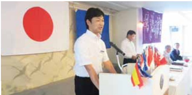
太田計画委員長 年次計画の発表