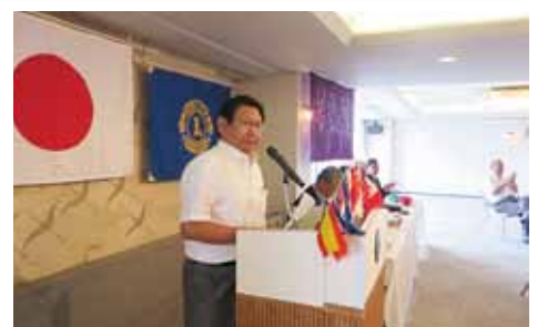
樫本前会長 前年度決算の承認