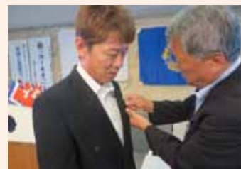
ライオンバッジ贈呈