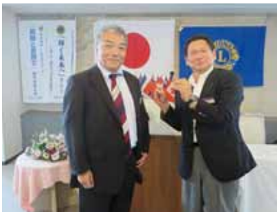
ゴング・バッジの引き継ぎ