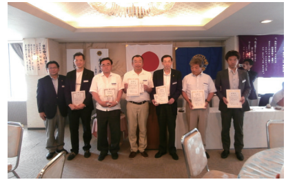
前年度クラブ役員に感謝状 及び記念品の贈呈