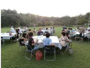
向島洋らんセンターにて 和やかに例会スタート