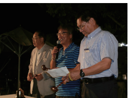
尾道瑠璃LC：33名 尾道みたとLC：20名 尾道向島LC：18名 合計：71名の出席でした。