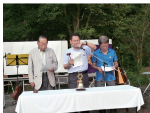
開会ゴング並びに 開会宣言