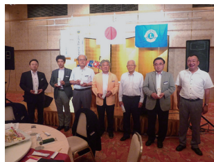
本年度例会純皆出席者 会長表彰をいただきました