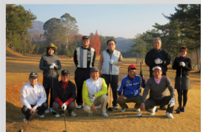
松永カントリークラブ