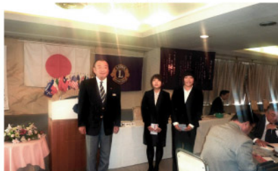
毎年夏休みに東映京都撮影所に尾道市立大学生を派遣しており、今年は2人の学生がインターンシップを行い、その報告会が行われました。