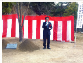
この植樹式に、平谷祐宏 尾道市長もかけつけてくださいました。