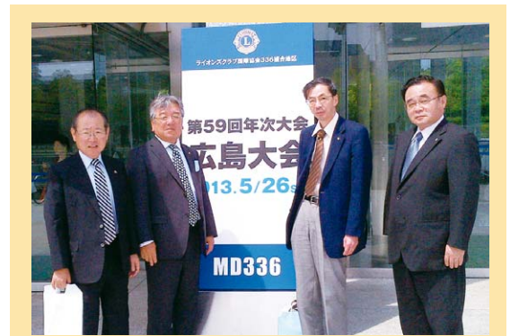
336複合地区第59回年次大会 広島国際会議場にて 5月26日(日)開催