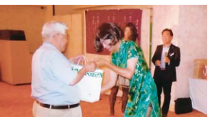
アトラクション…くじ引き