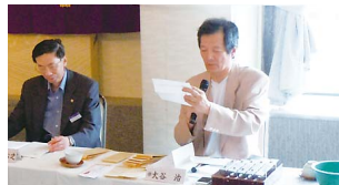
テール・ツイスターの時間