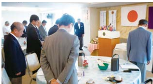
物故会員の冥福を祈り黙祷