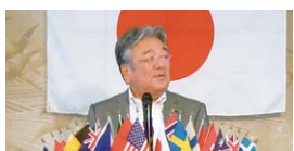
3R.1Z.Z.C 挨拶 九十九 誠さん