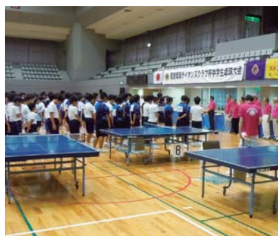
尾道瑠璃ライオンズクラブ杯「中学校卓球大会」