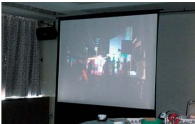
インターンシップ報告