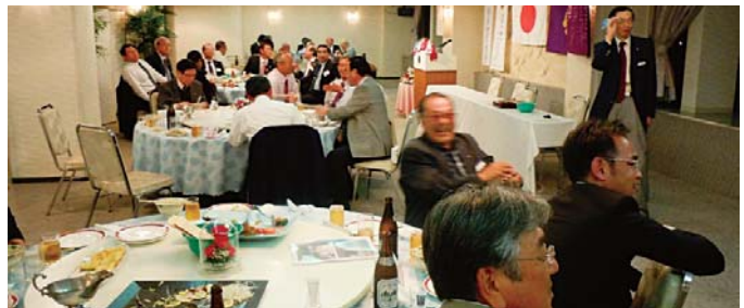
アトラクション…ダーツゲーム