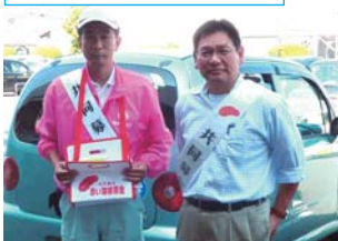
サティ尾道店・フジグラン尾道店で 参加協力しました。