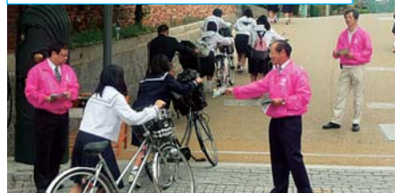
早朝、336-C地区一斉ライオンズデーアクティビ ティとして「薬物乱用防止啓発活動」を行いました。