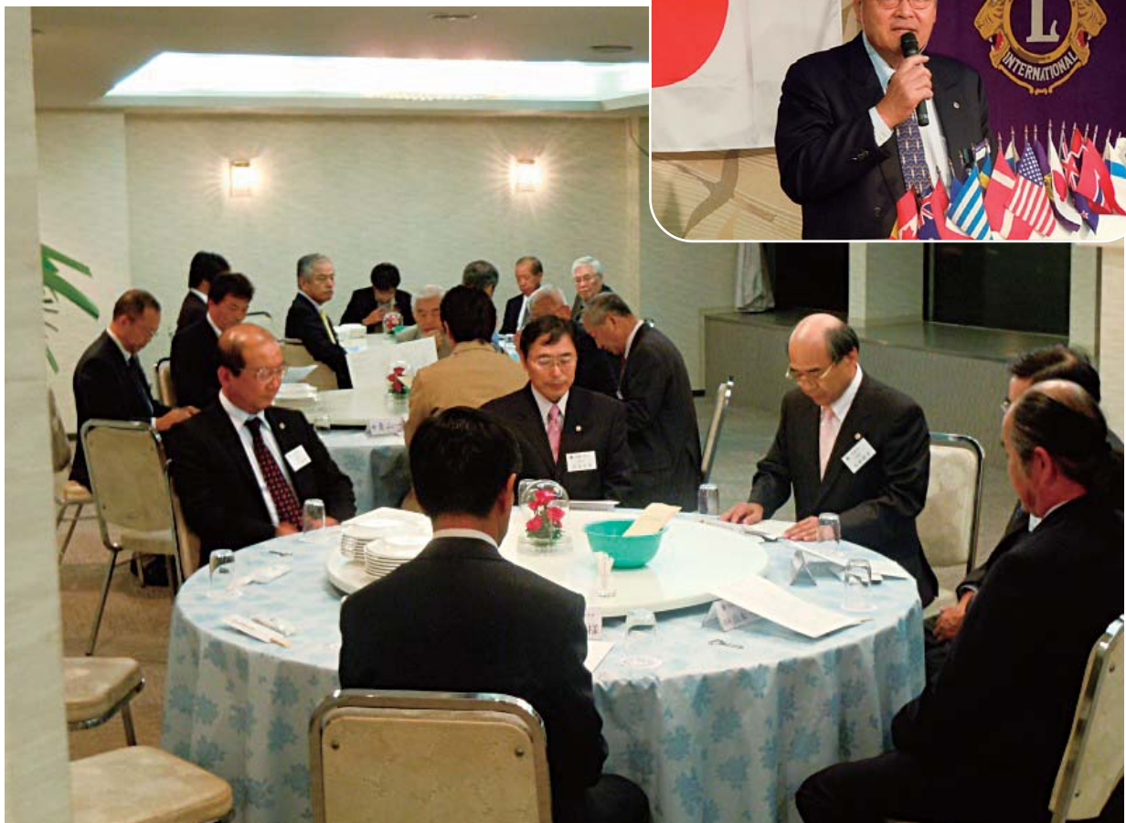
尾道瑠璃ライオンズクラブ第1147回例会 CN47周年記念例会