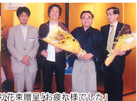
次期会長・幹事より花束贈呈「お疲れ様でした」