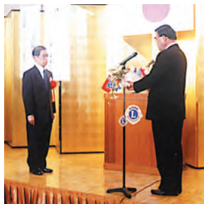
スポンサークラブに 感謝状、記念品贈呈