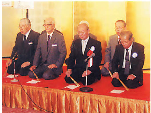
清興 謡曲「四海波」 るり謡会